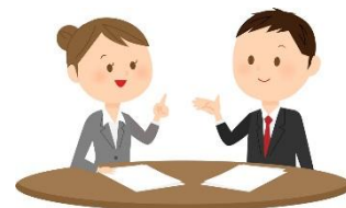
協働と連携で 可能性∞！